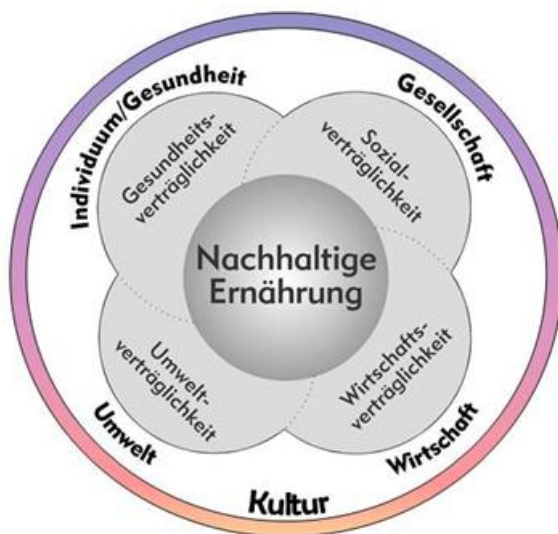
Abbildung 3: Fünf Dimensionen einer Nachhaltigen Ernährung [nach v. Koerber et al. 2012, v. Koerber 2014]