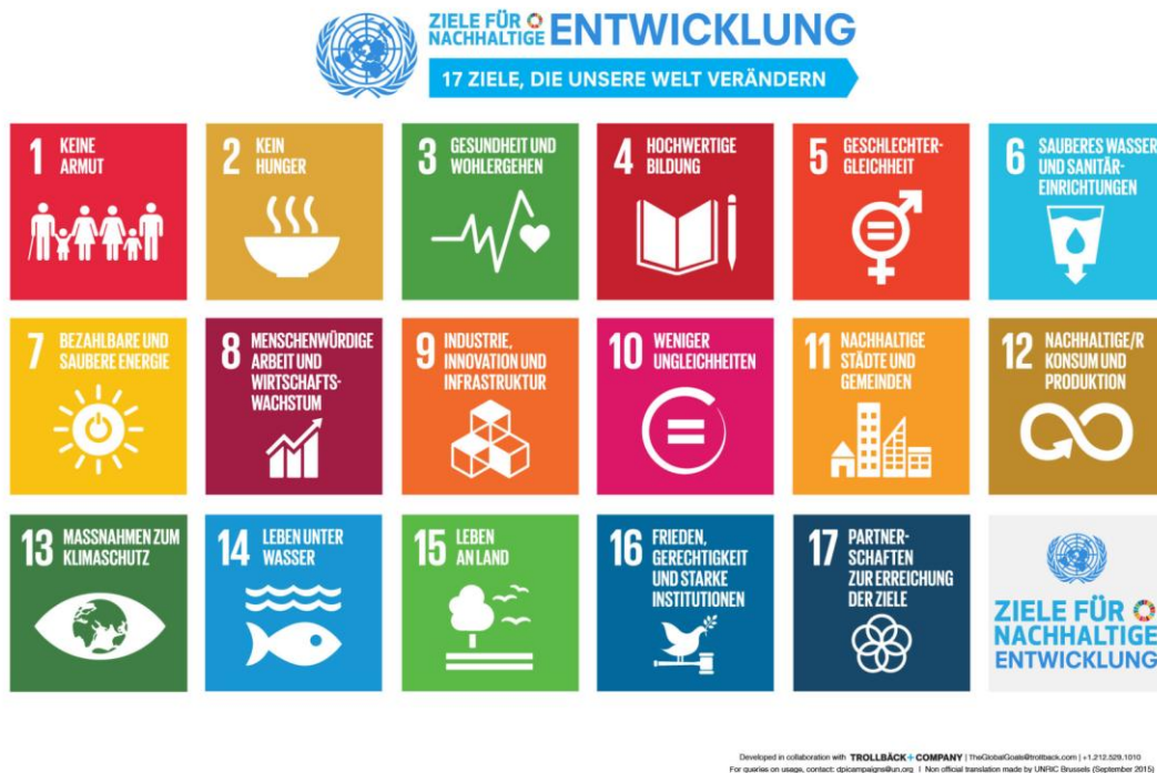
Abbildung 1: UN-Ziele für nachhaltige-Entwicklung – Sustainable Development Goals (SDGs) [UN 2016]